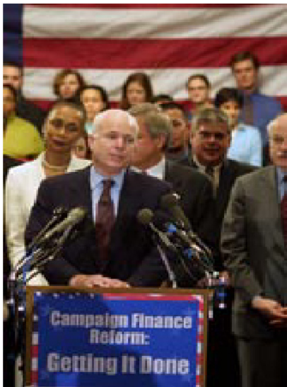
O senador republicano John McCain empenhou-se muito na tentativa de reformar o sistema de financiamento das campanhas. Ainda está em discussão uma reforma satisfatória

candidatos a presidente têm a gigantesca tarefa de organizar suas campanhas primárias em cada estado e então, se indicados, em toda a nação.