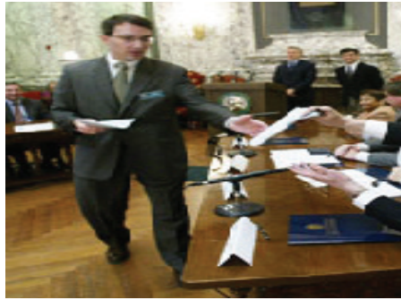
Na foto, o Colégio Eleitoral do estado de Washington apura seus 11 votos em 2004 destinados ao candidato democrata à presidência, John Kerry

Os fundadores da nação desenvolveram o sistema de Colégio