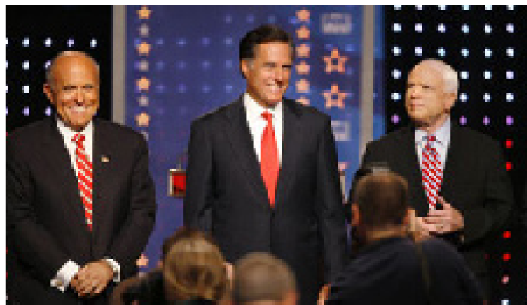
Três homens que esperam vencer a indicação republicana para candidato à Presidência em 2008 (da esquerda para a direita): Rudolph Giuliani, Mitt Romney e John McCain posam antes de debate a ser transmitido pela televisão para todo o país. Embora as eleições primárias dos partidos ocorram separadamente em cada estado, debates nacionais influenciam os eleitores em todas as primárias estaduais

Cada cargo eletivo federal tem requisitos diferentes, expostos nos Artigos I e II da Constituição dos EUA. Um candidato a