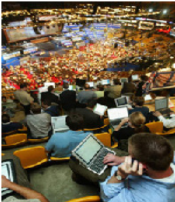
Blogueiros da internet atualizam seus blogs sobre a Convenção Nacional Democrata em Boston, em 2004. As convenções presidenciais modernas tendem mais para alegres espetáculos de mídia do que para política séria

Apesar da longa e expressiva evidência de partidarismo organizado no sistema político americano, um componente arraigado na cultura cívica do país é a crescente desconfiança