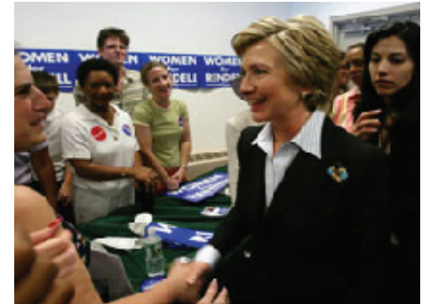
Acima: Pré-candidato presidencial republicano para 2008, Rudolph Giuliani, dá autógrafos em Bluffton, Carolina do Sul. Abaixo: A pré-candidata presidencial democrata (2008), Hillary Clinton, visita simpatizantes em Narberth, Pensilvânia