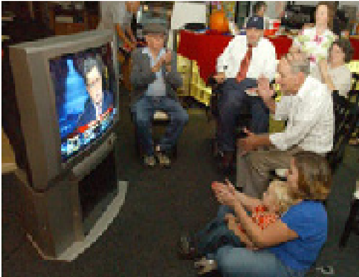
Após a Segunda Guerra Mundial, a televisão fez das eleições um entretenimento popular. Na foto, membros do partido se reúnem para saber os resultados das eleições na sede republicana em Meridian, Mississippi

Mas as pressões democratizantes ressurgiram após a Segunda Guerra Mundial. Pela primeira vez, a televisão proporcionou uma