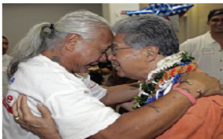
O senador Daniel K. Akaka (D) do Havai (à direita) cumprimenta na maneira tradicional um correligionário na sede de sua campanha em Honolulu

a uma ideologia ou a um conjunto de metas políticas. Ao contrário, eles tradicionalmente têm se preocupado acima de tudo em vencer as eleições e controlar os poderes eletivos do governo.