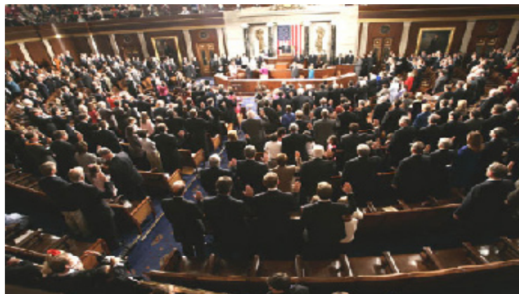
Membros do 109 o Congresso fazem seu juramento de posse na Câmara, no Capitólio, em 2005

Embora os dois maiores partidos organizem e dominem o governo nas esferas nacional, estadual e local, eles tendem a