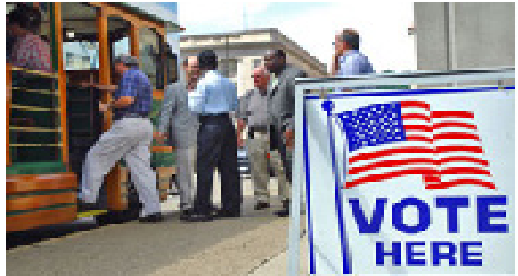
Eleitores deixam local de votação na Virgínia Ocidental. Esse grupo de pastores foi votar contra medida que amplia a legalização do jogo

votação) estão presentes nas eleições dos EUA desde os anos 1970. Argumenta-se também que essas são as pesquisas mais controversas, porque dão às redes de TV meios de prever vitórias eleitorais baseadas em entrevistas com pessoas que acabaram de votar. As pesquisas de boca-de-urna ficaram especialmente malvistas nas eleições presidenciais dos EUA de 2000, quando foram usadas de maneira equivocada pelas redes de televisão para fazer não apenas uma, mas duas projeções incorretas sobre o vencedor escolhido pelos eleitores na Flórida. A pressão para anunciar a projeção primeiro superou a pressão para anunciar a