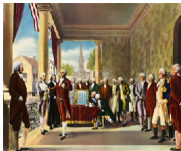
George Washington presta juramento de posse como primeiro presidente dos Estados Unidos, em 1789. Embora Washington não confiasse em facções políticas, os partidos populares começaram a crescer durante seu mandato

Por fim, as convenções nacionais para indicação de candidatos substituíram o King Caucus como forma de escolher os indicados dos partidos. Em 1831, o partido “nânico” Antimaçônico reuniu-se em uma taverna na cidade de Baltimore, Maryland, para escolher seus candidatos e redigir uma plataforma de atuação.