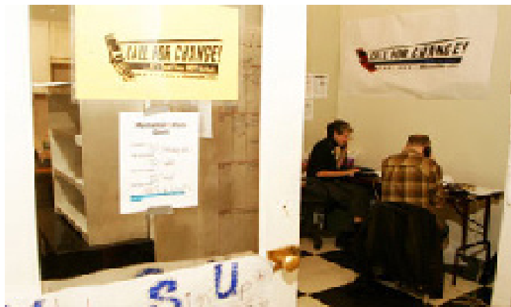
Os comitês de ação política podem fazer lobby e captar recursos de todas as maneiras. Podem telefonar para mobilizar eleitores...

emitir declarações de posicionamento; pôr anúncios no rádio, na televisão, em publicações e na internet; e fazer muitas aparições públicas e eventos para captação de recursos. O candidato à Câmara dos Deputados baseará essas atividades no seu distrito congressional específico, ao passo que o candidato ao Senado fará o mesmo em todo o estado. (Os deputados e senadores podem também organizar eventos específicos para captação de recursos em qualquer outro lugar, como Washington, D.C.). Os