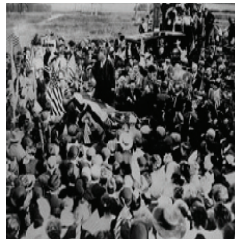
Candidatos presidenciais de um terceiro partido surgiram por diversas vezes no século 20. Embora não tenham sido vitoriosos, tiveram influência nas eleições presidenciais. Nesta foto, o ex-presidente Teddy Roosevelt discursa para correligionários do seu próprio partido, "Bull Moose", em 1912

Terceiros partidos e candidatos independentes, apesar dos obstáculos discutidos anteriormente, têm sido uma característica periódica da política americana. Eles em geral levantam problemas sociais que os principais partidos deixaram de enfrentar no primeiro plano do discurso público — e na agenda governamental. A maioria dos terceiros partidos tende a florescer em uma única eleição e depois a acabar, definir ou ser absorvida por um dos partidos principais. Desde os anos 1850, apenas um partido novo, o Partido Republicano, surgiu para assumir a condição de grande partido. Naquele momento, havia uma questão moral imperativa — a escravidão — dividindo a nação. Essa questão forneceu a base para o recrutamento de