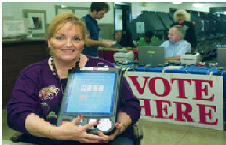
Funcionária encarregada das eleições exibe novo dispositivo para votação em Austin, Texas

Nos Estados Unidos, a votação é um processo de duas etapas. Não há uma lista nacional de eleitores qualificados, dessa maneira um cidadão precisa primeiro se qualificar, registrando-se. Os cidadãos registram-se para votar no local em que moram; caso se mudem para outro lugar, devem se registrar outra vez no novo endereço. Os sistemas de registro foram projetados para eliminar fraudes, mas os procedimentos para registrar eleitores variam