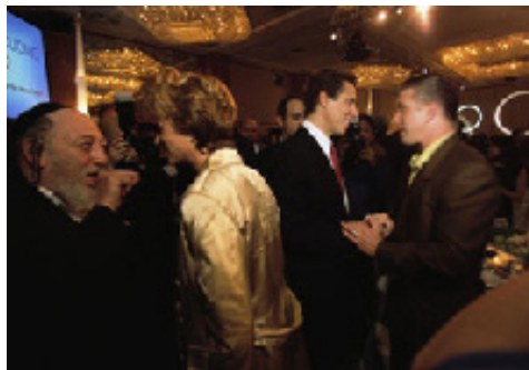
O político nova-iorquino Andrew Cuomo (centro) conversa com correligionários em evento para arrecadação de recursos durante sua campanha para governador

Vários tipos de comitês políticos são registrados na FEC. Além dos candidatos, os partidos políticos precisam registrar seus comitês nessa agência. Ademais, qualquer grupo privado de cidadãos pode formar um comitê político. Por exemplo, grupos de pessoas de empresas, sindicatos trabalhistas e associações comerciais muitas vezes formam tais comitês (embora a utilização de fundos da tesouraria das empresas ou dos sindicatos trabalhistas seja proibida). Esses comitês políticos são muitas vezes denominados CAPs, ou comitês de ação política, e também