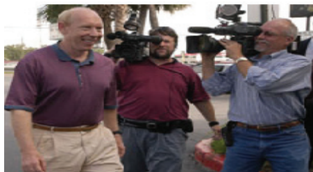
No sistema federativo estratificado dos EUA, as eleições locais são tão importantes quanto as eleições nacionais para os cidadãos locais. Na foto, o candidato à prefeitura de Houston, Bill White, em apresentação para a mídia

apoio eleitoral e da necessidade de trabalhar numa sociedade, que em termos ideológicos situa-se em sua maioria no centro, os partidos americanos adotaram posições políticas essencialmente centristas. Como ressaltado, eles também apresentam um alto grau de flexibilidade política. Essa abordagem não doutrinária possibilita a republicanos e democratas tolerar uma grande diversidade em seus quadros e tem contribuído para sua capacidade de absorver terceiros partidos e movimentos de protestos quando surgem. Em geral, o Partido Republicano é considerado conservador — com ênfase maior nos direitos de propriedade e na acumulação privada de riqueza, e o Partido Democrata é tido como mais à esquerda, favorecendo políticas sociais e econômicas liberais. Na prática, quando chegam ao poder, os dois partidos tendem a ser pragmáticos.