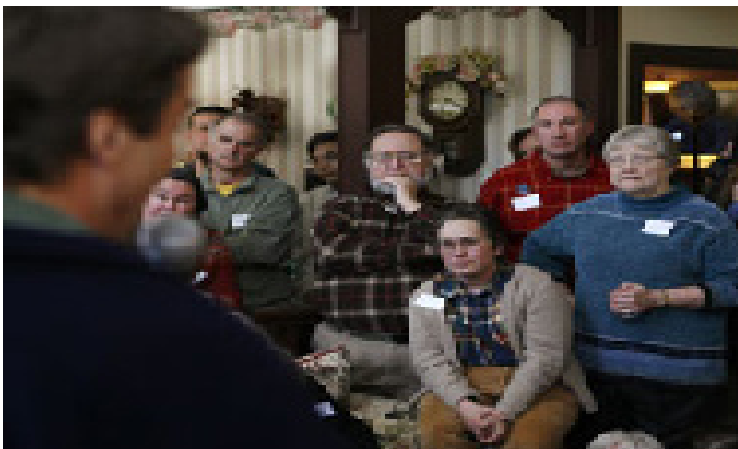
Na foto, o colégio eleitoral do estado de Washington apura seus 11 votos em 2004 destinados ao candidato democrata à presidência, John Kerry

é uma barreira estrutural adicional aos terceiros partidos. Entre as democracias do mundo todo os Estados Unidos são a única nação a recorrer às eleições primárias para indicar os candidatos dos partidos à Presidência, ao Congresso e a cargos eletivos estaduais. Como observamos, de acordo com esse modelo de sistema de indicação, em uma eleição primária os eleitores da base partidária escolhem o candidato a ser indicado pelo partido para a eleição geral. Na maioria das nações, as indicações partidárias são controladas pelas organizações partidárias e por seus líderes. Mas nos Estados Unidos, é comum hoje em dia que os eleitores tenham a palavra final sobre quem serão os indicados dos partidos Democrata e Republicano.