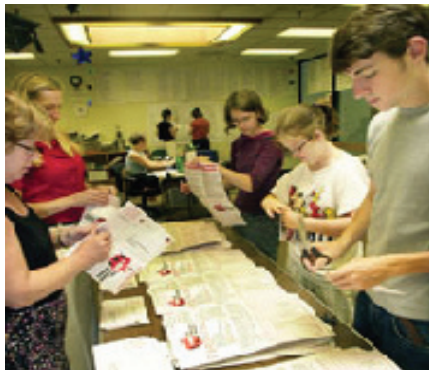
O estado de Washington permite aos cidadãos incluir iniciativas na cédula eleitoral desde 1912, se um número suficiente de eleitores assinar uma petição nesse sentido. Na foto, voluntários a favor de uma iniciativa sobre educação abrem e fazem a triagem de petições em Seattle

significar mais do que simplesmente escolher pessoas para um cargo público. Em alguns estados e localidades, assuntos de políticas públicas podem também ser incluídos na cédula para a aprovação ou não dos eleitores. Medidas submetidas aos eleitores pelo Legislativo estadual ou pela Junta ou Câmara local — referendos — e os incluídos na cédula por petição dos cidadãos — iniciativas — referem-se normalmente a questões relacionadas com títulos do governo (aprovação de empréstimos para projetos públicos) e outras imposições ou restrições ao governo. Nas últimas décadas, essas medidas submetidas a plebiscito eleitoral causaram impactos importantes, em particular nos orçamentos e nas políticas estaduais, sobretudo com relação ao sistema educacional no estado da Califórnia.