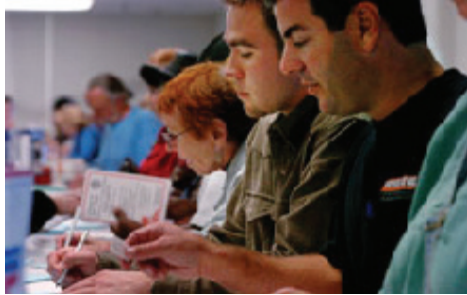
Eleitores preenchem formulários antes de votar, San Diego, 2004

Nos Estados Unidos, as eleições ocorrem em todos os anos pares para alguns cargos federais e para a maioria dos cargos estaduais e locais. Alguns estados e jurisdições locais realizam eleições em anos ímpares.