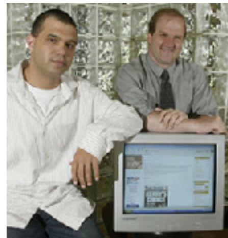
Cada vez mais, a internet é usada para levantar fundos e chamar a atenção para candidatos praticamente sem chance de vencer. Um candidato congressista de Ohio (à direita) e seu diretor de comunicações (à esquerda) posam mostrando sua página de blogue

A veiculação de vídeo em sites, como o YouTube, propiciou oportunidades e preparou armadilhas para as campanhas políticas. Os candidatos se aproveitaram da tecnologia para produzir vídeos, às vezes humorísticos, sobre si mesmos. Em outras ocasiões, candidatos foram surpreendidos em momento de descontração dizendo ou fazendo algo que não diriam ou fariam