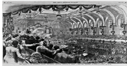
Convenções para indicação de candidato são uma antiga tradição política nos EUA. No alto, delegados na convenção do Partido Republicano, Chicago, 1868. Abaixo, Convenção Nacional do Partido Democrata, Cincinnati, 1880

cada vez maiores da população adulta à medida que as restrições com base em propriedade, raça e sexo eram eliminadas. Com a ampliação do eleitorado, os partidos políticos se desenvolveram para mobilizar a crescente massa de eleitores como meio de controle político. Os partidos políticos foram institucionalizados para realizar essa tarefa essencial. Assim, os partidos surgiram nos Estados Unidos como parte da expansão democrática e, com início nos anos 1830, tornaram-se solidamente estabelecidos e poderosos.