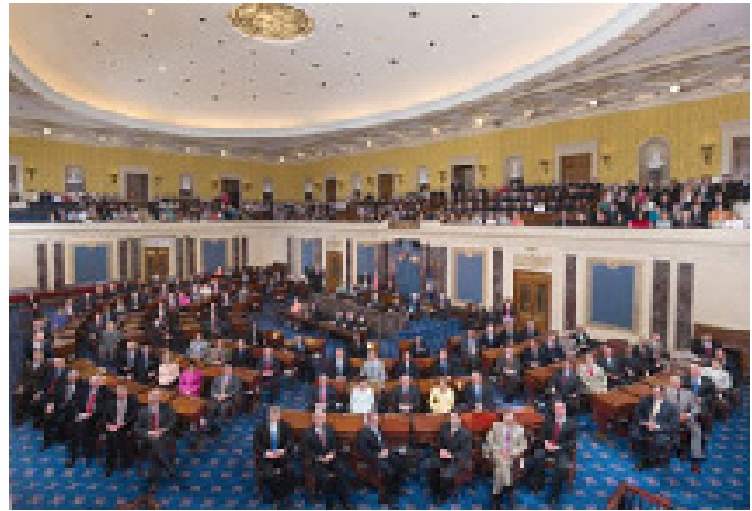
A Câmara Alta do Congresso, o Senado, foi projetada pelos fundadores para ser uma força conservadora e estabilizadora. Aqui, os 100 senadores posam para fotografia

uma cadeira na Câmara, e o restante é destinado aos estados de acordo com o tamanho da população. O Alasca, por exemplo, tem uma população muito pequena e por isso possui apenas uma cadeira na Câmara. A Califórnia é o estado mais populoso e mantém 53 cadeiras. Após cada censo decenal, o número de cadeiras designadas a um estado é recalculado para considerar as mudanças demográficas nos últimos dez anos, e os legislativos estaduais redistribuem os distritos congressionais dentro dos estados para refletir mudanças no número de cadeiras a eles destinadas ou o deslocamento da população dentro do estado.