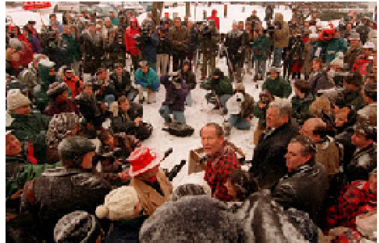
Eleições primárias estado por estado (ou às vezes caucuses) tornaram-se o caminho para as indicações presidenciais republicanas e democratas. Na foto, o aspirante republicano à Presidência, Lamar Alexander (no centro, de camisa xadrez), cumprimenta a mídia e os eleitores das primárias de New Hampshire no primeiro trimestre de 1996

mídia pela qual as pessoas podiam agora ver, além de ouvir, as campanhas políticas em casa. Candidatos à Presidência plausíveis podiam usar a exposição na televisão para demonstrar seu apelo popular. As décadas que se seguiram trouxeram de volta reformas democratizantes para ampliar a participação nas convenções de indicação de candidatos dos partidos.