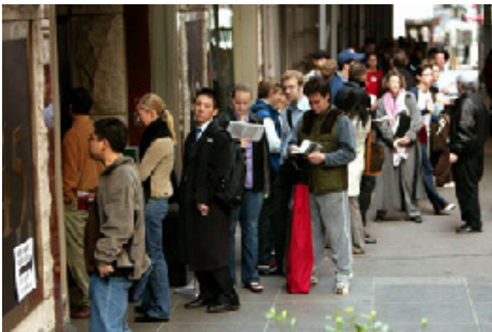
Eleitores esperam pacientemente para votar devido a uma falha no equipamento de votação, cidade de Nova York, 2004

equipamentos e as cédulas em geral são comprados pelos funcionários no âmbito local, o tipo e a condição do equipamento que os eleitores usam muitas vezes estão relacionados com a situação socioeconômica e a base tributária da localidade. Uma vez que a receita tributária local também financia escolas, serviços da polícia e do corpo de bombeiros, bem como instalações de recreação e parques, freqüentemente, pouca prioridade é dada aos investimentos para tecnologia de votação.