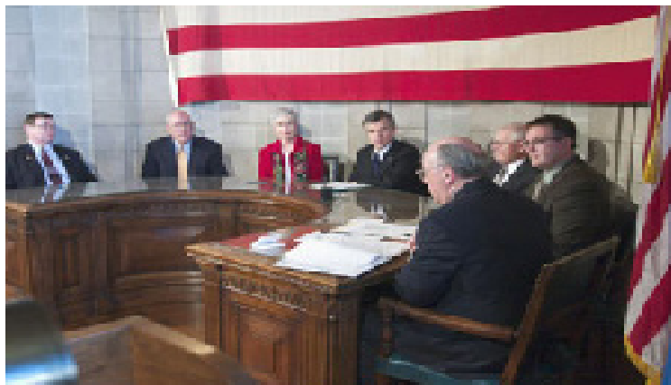
Reunião do Colégio Eleitoral de Nebraska em dezembro de 2004 para apurar os cinco votos destinados ao presidente George W. Bush, em Lincoln, Nebraska

Diferentemente dos sistemas proporcionais, comuns em muitas democracias, o sistema distrital de representante único só permite que um único partido vença em determinado distrito. O sistema de representante único, portanto, incentiva a formação de partidos nacionais com ampla base de apoio e suficientes habilidades de gerenciamento, recursos financeiros e apelo popular para obter pluralidade nos distritos legislativos de todo o país. Nesse sistema, candidatos de partidos menores ou terceiros partidos ficam em desvantagem. Partidos com recursos financeiros e apoio popular mínimos tendem a não conseguir nenhuma representação. Assim, é difícil para novos partidos obter um nível de representação proporcional viável e conquistar expressão nacional, por causa da estrutura de “o vencedor leva tudo” do sistema eleitoral americano. Por que dois em vez de, digamos, três partidos nacionais bem financiados? Em parte por considerar-se que dois partidos oferecem ao eleitor gama suficiente de escolha, em parte porque historicamente os americanos não gostam de extremos políticos e em parte porque os dois partidos são abertos a novas idéias (veja abaixo).