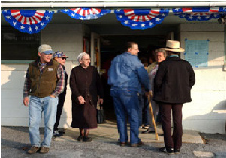
Eleitores na zona rural da Pensilvânia (inclusive membros da comunidade Amish) entram e saem de um local de votação

votação) estão presentes nas eleições dos EUA desde os anos 1970. Argumenta-se também que essas são as pesquisas mais controversas, porque dão às redes de TV meios de prever vitórias eleitorais baseadas em entrevistas com pessoas que acabaram de votar. As pesquisas de boca-de-urna ficaram especialmente malvistas nas eleições presidenciais dos EUA de 2000, quando foram usadas de maneira equivocada pelas redes de televisão para fazer não apenas uma, mas duas projeções incorretas sobre o vencedor escolhido pelos eleitores na Flórida. A pressão para anunciar a projeção primeiro superou a pressão para anunciar a